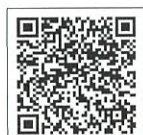
京都芸術劇場モバイルサイト

携帯電話から http://www.k-pac.org/theatre/m/m ※要事前登録（無料）