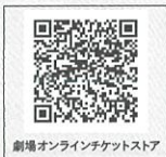
劇場オンラインチケットストア