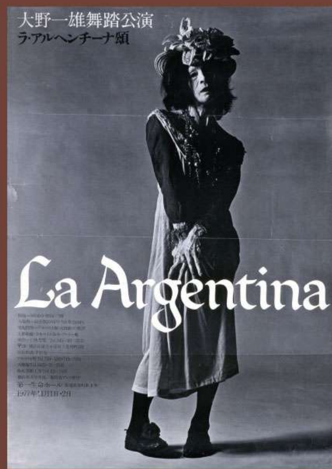
「ラ・アルヘンチーナ頌」(1977年ポスター)