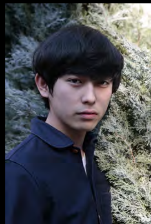
演出家プロフィール