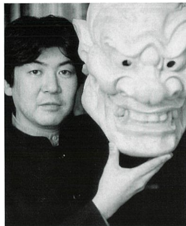
野村 万之丞 (総合芸術家・狂言師)

古くて新しい東西文化の融合を提唱し、21世紀の文化産業を創造すべく様々な分野で活動を展開している。大学教授、プロデューサー、執筆家、演出家、NHK大河ドラマの芸能考証と多岐に渡り、また、狂言、野村万蔵家の八代目当主、「萬狂言」代表として活躍中。2005年に八世野村万蔵を襲名。重要無形文化財総合指定、(社)能楽協会理事。京都造形芸術大学教授。フランス芸術文化勲章シュバリ工を受章。