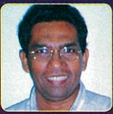
ラヴィバンドゥ Ravibandhu (Sri Lanka)