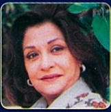
サミーナ・アフマド Samina Ahmed (Pakistan)