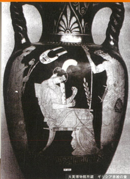
大英博物館所蔵 ギリシア赤絵の壺