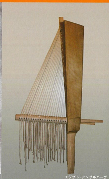
エジプト・アングルハープ