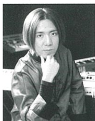
金大偉 演奏 (音楽家・映像作家)