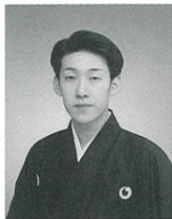
藤間信乃輔 (日本舞踊流派藤間流)