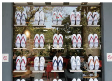
京都の伝統技術の研究や 活用商品の展示

洛中洛外図屏風舟木本に描かれた出雲の阿国の物語や京おどりを題材としたアート展示や オリジナル商品販売など春秋座を中心に周遊をお楽しみください。