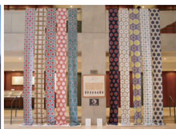
様々な分野の若手クリエイターによる作品展示