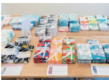
宮川町×学生のデザインでぬぐい販売