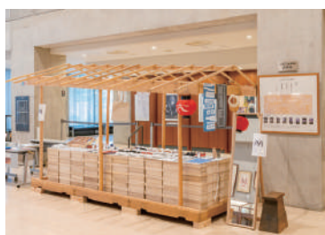
京おどり限定グッズや和雑貨の販売