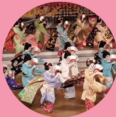
【 最終章の宮川音頭は 芸舞妓総出演で群舞します。 】