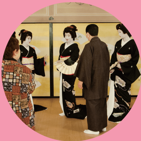
【 新作ストーリーと、芸舞妓による 華麗な舞で魅了します。 】

フィナーレとなる最終章の「宮川音頭」では芸妓、舞妓が総出演し、一糸乱れぬ動きで華やかに郡舞します。