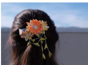
伝統技術を活用した和雑貨販売