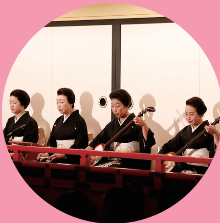
【 芸妓の三味線生演奏と唄で、 舞台の世界観と物語を演出します。 】