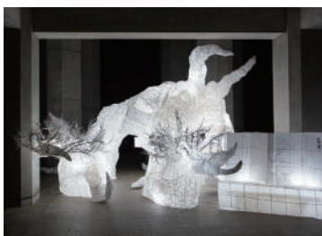
第73回京おどりの演出を基にした 立体作品展示