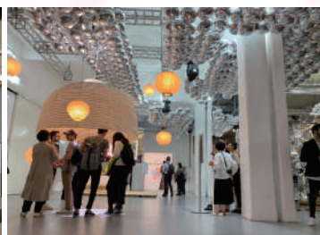
伝統的な技術を活用した空間展示