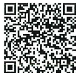
劇場モバイルサイト