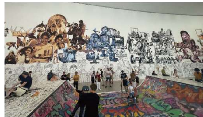
BAAN NOORG COLLABORATIVE ARTS & CULTUREの会場の様子

ドクメンタとはドイツのカッセルで5年に一度行われる大型芸術祭である。15回目となるドクメンタ15では総合キュレ