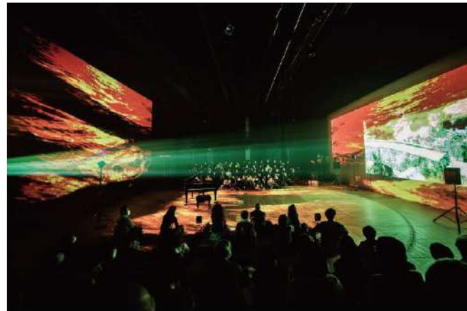
【図1】会場を包み込む映像と音響

本劇場実験では、音声と映像の記録メディアをプロジェクションする層のレイアウトおよび軽重の制御による舞台演出手法が検討された。この手法の有効性は、電子音響音楽や映画のように〈いつでも・どこでも〉を基本とした複製芸術においても、上演会場の特性を活かしたプロジェクションの演出によって、作品体験の一回性、つまり、〈いま・ここ〉の体験として強調できるかどうか、ポイントであると考えられる。本実験は春秋座でカスタマイズされたが、今後も別の機会においては層の構成とレイアウトを変更して上演することを構想している。執筆時点(2023年8月下旬)では、早稲田小劇場どらま館(2023年8月4～6日)での公演が終了した。また、近い将来、慶應義塾高等学校日吉協育ホール(2023年11月)での公演も予定されており、引き続きご注目いただければ幸いである。なお、本報告では演出の形式面についてのみを報告し、作品内容と演出の関連についても触れるべきであるが、紙面の都合により、別の機会に譲ることとする。