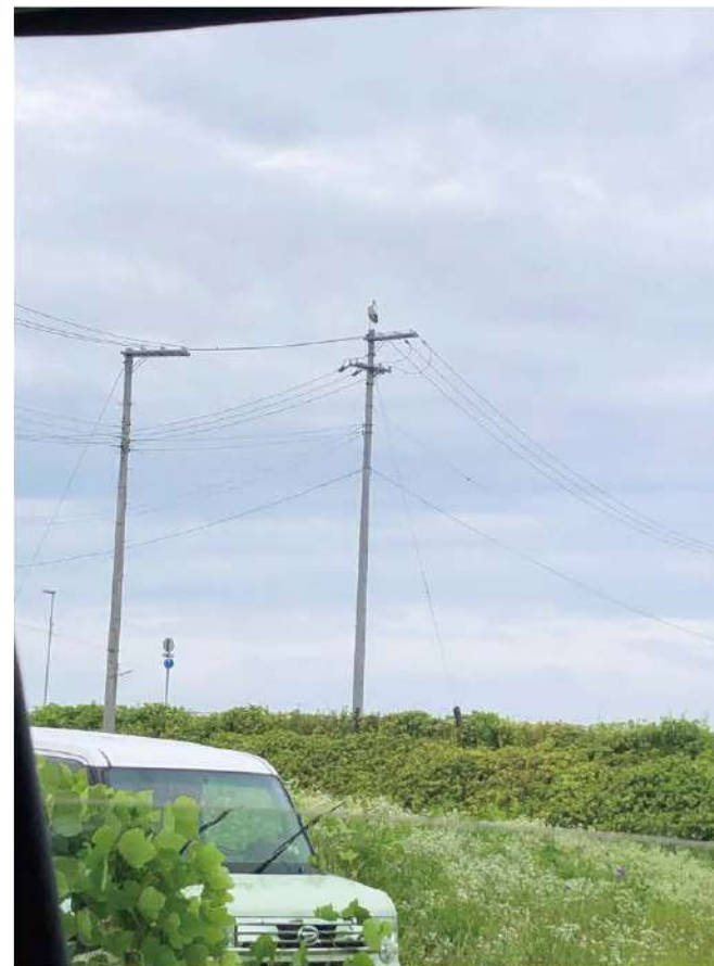
電柱にとまったコウノトリ（兵庫県豊岡市）

また他にも豊岡市民の複数の方々にもお話を伺う機会があり、それぞれの立場からコウノトリについて話していただいた。