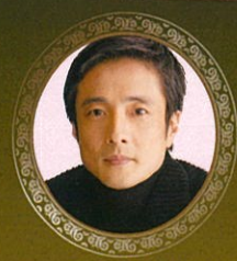
ラムゼイ卿 橋爪 淳