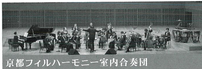
京都フィルハーモニー室内合奏団

現在、出雲芸術アカデミー芸術監督、出雲フィルハーモニー交響楽団音楽監督兼常任指揮者、くらしき作陽大学音楽学部講師。