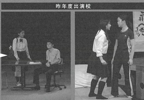
「志望理由書」 滝川第二高等学校(兵庫)

昨年度出演の滝川第二高等学校は2014年7月の全国大会にて優秀賞、創作脚本賞を受賞しました。