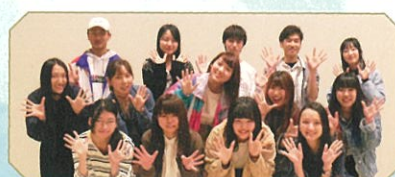
京都造形芸術大学「アリスの森」学生プロジェクトチーム

対象: 「不思議の国のアリス」のこどもチケットを購入されたお子様及びその保護者(原則)。料金: 500円(材料費) 定員: 50組程度まで 申込方法: 「不思議の国のアリス」チケットをご購入の上、受付期間内に京都芸術劇場ウェブサイトの専用フォームからお申込下さい。 http://k-pac.org/ 受付期間: 2018年7月6日(金)10:00~7月30日(月)17:00 *但し定員に達し次第、受付終了いたします。