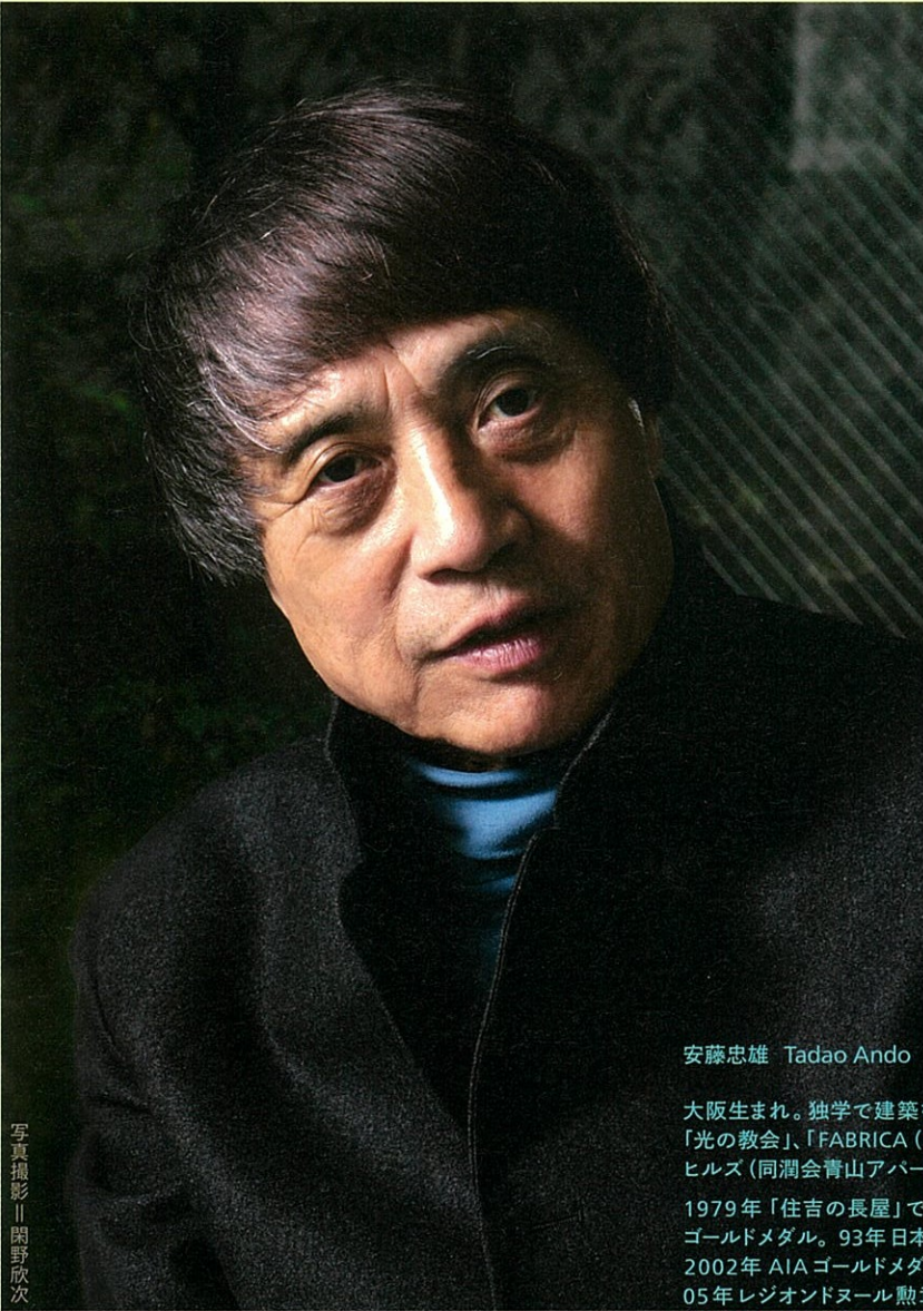
安藤忠雄 Tadao Ando

大阪生まれ。独学で建築を学び、1969年に安藤忠雄建築研究所を設立。代表作に「六甲の集合住宅」、「光の教会」、「FABRICA (ベネトンアートスクール)」、「ビューリッツァー美術館」、「地中美術館」、「表参道ヒルズ (同潤会青山アパート建替計画)」、「プンタ・デラ・ドガーナ」、「上海保利大劇場」など。