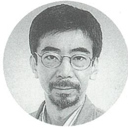
演出 / 松本重孝