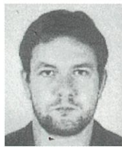
ヴァリニャーノ / ゲオロギ・キロフ