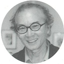
台本 / 謝名元慶福