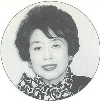
原作 / 富士谷あつ子

らず、舞台はやがて誰によって占められるか…。グローバルにみれば、黄金の国と思われたジバングへのヨーロッパ人の熱い眼差し、キリスト教布教の聖職者らの苦闘と日本発見の驚き、幕藩体制確立以前の活気ある京の都の様相。阿国の歌舞伎創始を記念して新たに書き下ろされた現代歌舞伎の脚本を原作として、ジェンダー学、日本学、京都学の交差するオペラを上演する。