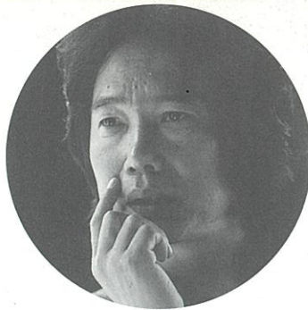
作曲 / 尾上和彦