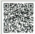
京都芸術劇場モバイルサイト