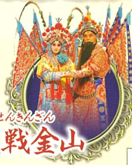
らいこせんきんざん 擂鼓戦金山