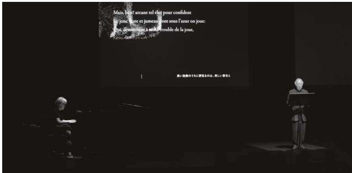
『マルメ・プロジェクト-21世紀のヴァーチャル・シアターのために』2010年7月24日、京都芸術劇場 春秋座

司会 小崎哲哉 ICA京都「REALKYOTO FORUM」編集長 京都芸術大学大学院教授