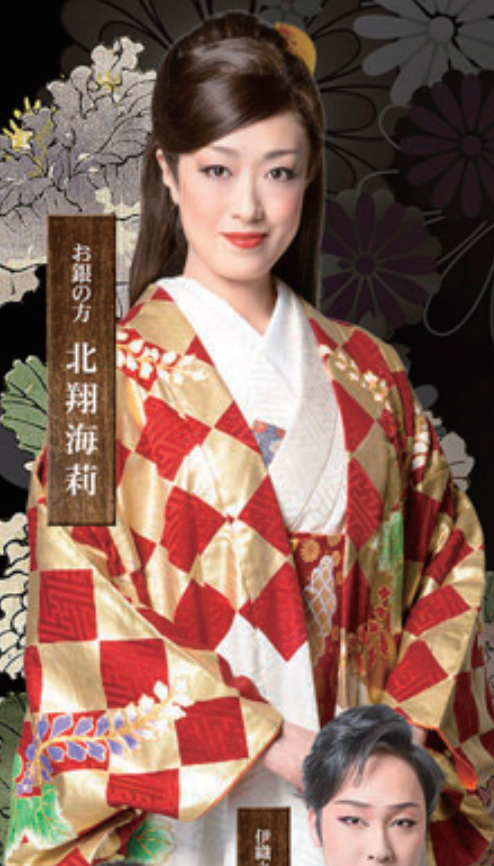
お銀の方 北翔海莉