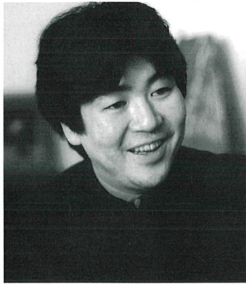
野村 万之丞 (総合芸術家・狂言師)

古くて新しい東西文化の融合を提唱し、21世紀の文化産業を創造すべく様々な分野で活動を展開している。大学教授、プロデューサー、執筆家、演出家、NHK大河ドラマの芸能考証と多岐に渡り、また、狂言、野村万蔵本家の八代目当主、「萬狂言」代表として活躍中。重要無形文化財総合指定、(社)能楽協会理事。京都造形芸術大学教授。フランス芸術文化勲章シュバリエを受章。