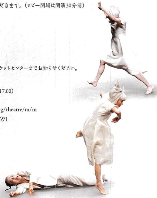
"tonight is nasty"

構成振付 笠井 叡 / 出演 山田せつ子 / 佐伯有香 野田まどか、福岡まな実、松尾恵美 / 笠井 叡 舞台美術 杉山 至 / 音響 宮田充規 / 照明 藤原康弘 / 衣裳 萩野 緑 / 舞台監督 大鹿 展明 写真 笠井 爾示 / 宣伝美術 井原靖章 / 制作協力 大使館 主催 京都造形芸術大学舞台芸術研究センター / 京都芸術センター制作支援事業