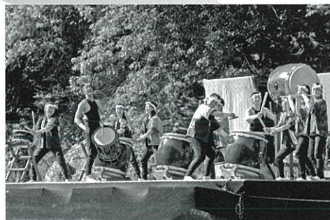
2009年度 嵐峡フェスティバル