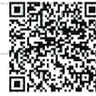
劇場モバイルサイト