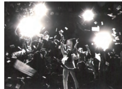
「新宿八犬伝 第一巻 一犬の誕生」初演時舞台写真 1985年6月新宿歌舞伎町・ACB(アシベ)ホール

私たちが生きる時代を常に鋭い視点で切り取ってきた劇作家・演出家の川村毅が、今ふたたび伝説の八犬士たちを登場させ、現在日本が迎える混迷の時代と、そこに生きる人々の物語を娯楽満載のスペクタクルのなかに描きだします。春秋座公演では、オーディションにより京都造形芸術大学の学生がアンサンブルとして出演。こちらも見ものです。