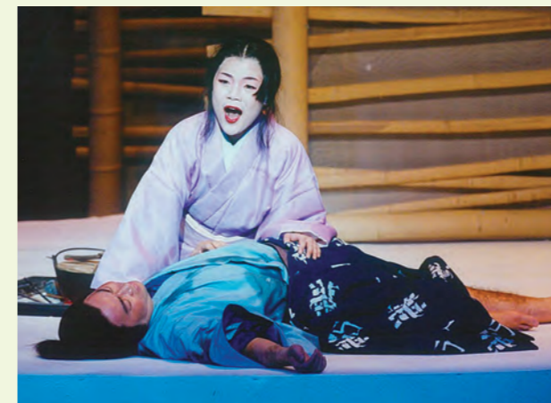
日本オペラ協会公演「夕鶴」2002年新国立劇場(中)

日本人の手になるオペラの最高傑作と言われる「夕鶴」。歌舞伎とオペラが理想的に上演できる春秋座での待望のオペラ公演が決定しました!