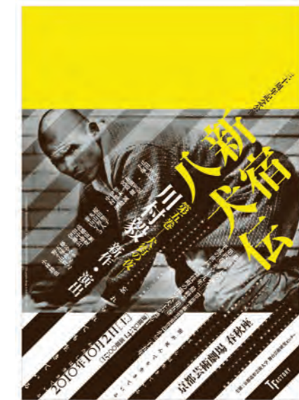
デザイン=町口寛